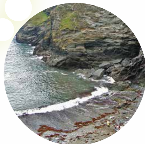
CUEVA DE MERLÍN