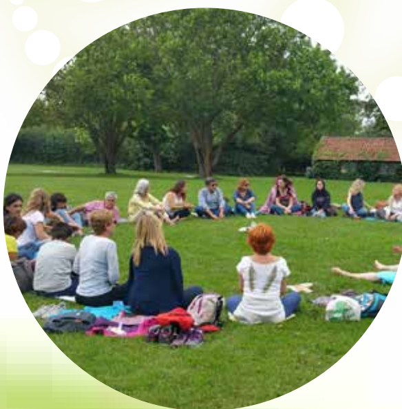
GRUPO EN LA ABADÍA