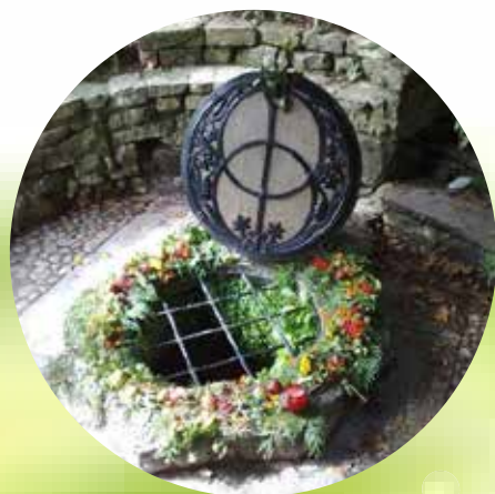
POZO SAGRADO DEL CHALICE WELL