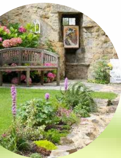
JARDÍN DE LA CAPILLA DE MARÍA MAGDALENA

En Glastonbury, así como en ciertos lugares de Francia, se rinde culto a M a Magdalena, ya que se la considera como una verdadera sucesora de las enseñanzas de Jesús. En esta capilla se reúnen grupos de todas las culturas y religiones para meditar (a veces no está abierta).