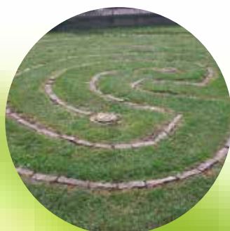
LABERINTO DE LA IGLESIA DE ST JOHN'S